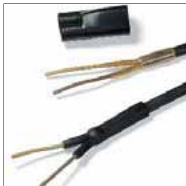
Limtape HMT200A for forsegling mot fukt.