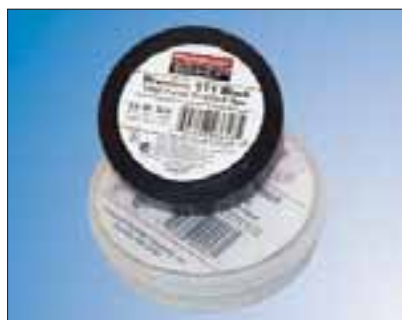
Premium 111, en god allværstape.